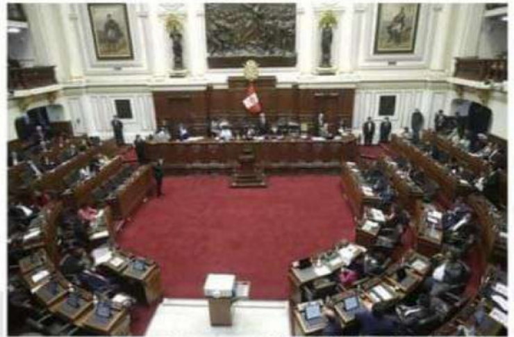
Congreso dice no puede tratar en esta legislatura el adelanto de elecciones.

El Congreso se encuentra actualmente en la segunda legislatura ordinaria que va desde el 1 de marzo al 15 de junio del presente año.