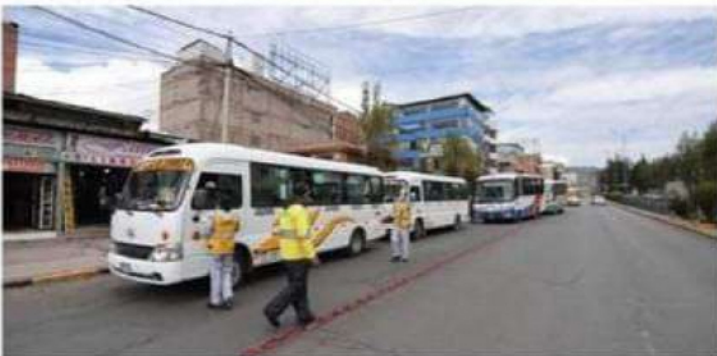
Concesión termina el 2024, pero transportistas solicitan ampliar hasta el 2029.

"En la fecha estamos en permanente diálogo con las autoridades y funcionarios de la municipalidad provincial para llegar a acuerdos de solución, faltando un año más para que culmine el contrato y si no es así nos atenderemos a las normas vigentes", sentenció.