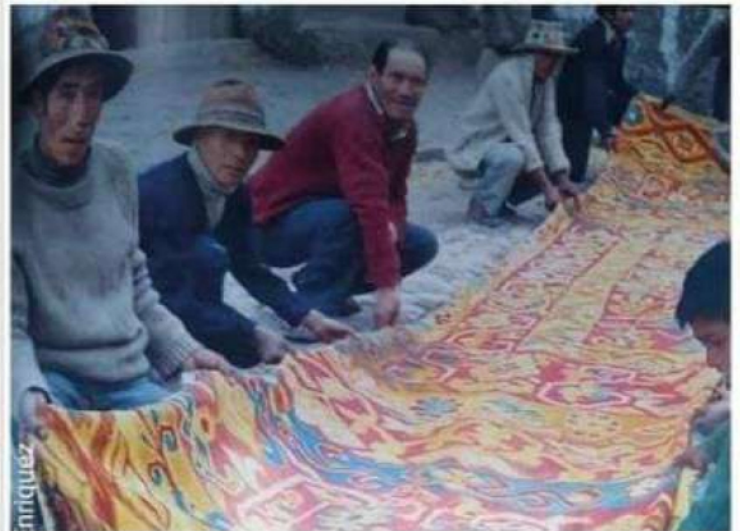
No hay referencia donde está actualmente la alfombra de Túpac amaru